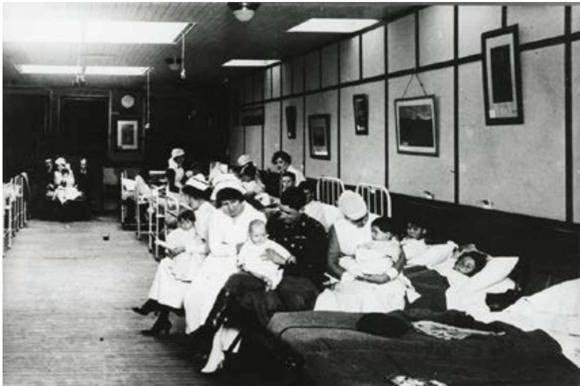
Courtoisie de Glenbow Museum, NA-521-8