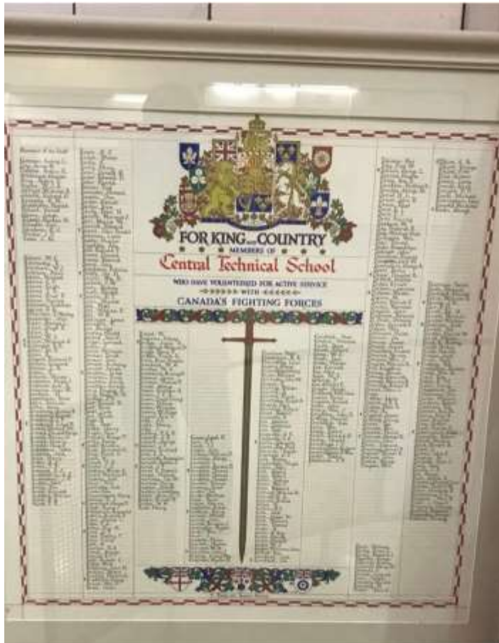
Image d'un mémorial mural d'une école secondaire de Toronto, fournie à titre d'exemple.